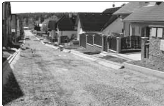
... v průběhu výstavby (duben 2009), ...