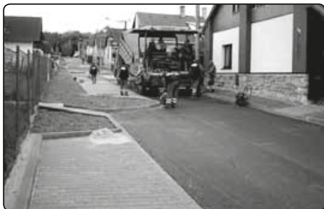
... při pokládání asfaltového povrchu (květen 2009), ...