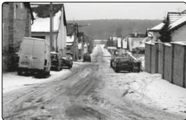
Havířská ulice před rekonstrukcí (leden 2009), ...