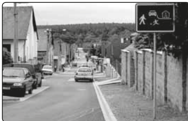
... a po dokončení stavebních prací (červen 2009)