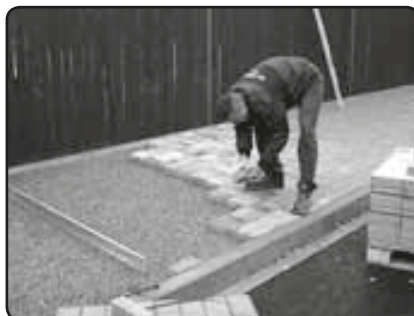
Pokládání chodníkové dlažby (listopad 2009)