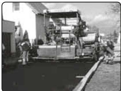
Pokládání asfaltového povrchu (listopad 2009)