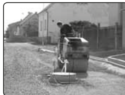
Válcování podkladových vrstev (září 2009)