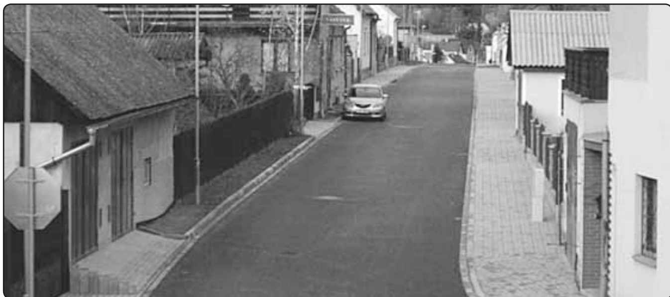
Tlučenská ulice po dokončení rekonstrukce (listopad 2009)