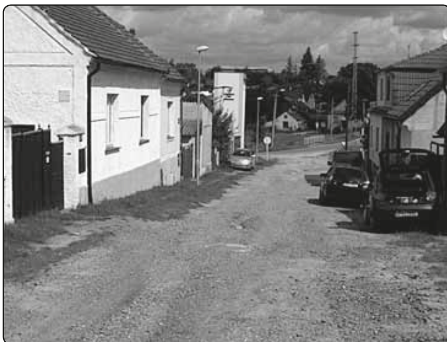
Tlučenská ulice před zahájením rekonstrukce (červenec 2009)

Tlučenská ulice je bezesporu jednou z nejdůležitějších komunikací v obci. Slouží nejen obyvatelům bydlícím v přilehlých nemovitostech, ale také jako přístupová cesta do areálu firmy C+C Líně, která patří k největším zaměstnavatelům na území obce. Je hojně využívána zahrádkáři z osady u Lučního potoka i pěšími a cyklisty z lokality Na Vypichu. Kvalitní povrch si tato ulice již zcela určitě zasloužila. Z dopravního hlediska byla nově zrekonstruovaná komunikace rozdělena na dva odlišné úseky. První, mezi ulicemi Plzeňská (průtah obcí, I/26)