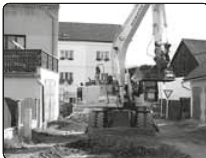
Zemní práce u křižovatky s Plzeňskou ulicí (říjen 2009)