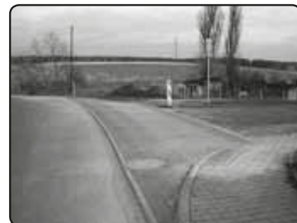
Nově vybudovaný zpomalovací práh při vjezdu z Hornické ulice (listopad 2009)