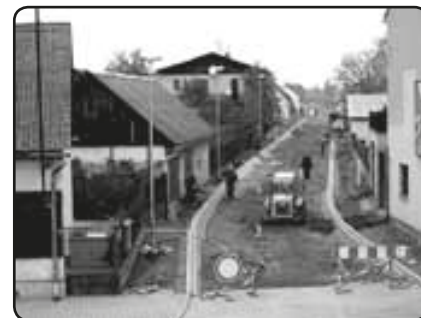
Jižní část Tlučenské ulice po osazení obrub (říjen 2009)