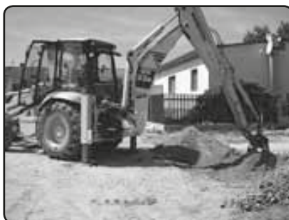
Zemní práce na křižovatce s Chodskou ulicí (srpen 2009)