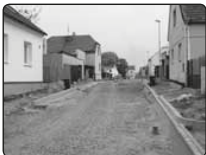
Betonování obrub v severní části ulice (srpen 2009)

doucnu po provedení rekonstrukce Chodské ulice napojen v hornické kolonii na silnici III. třídy do Tlučné. Druhý úsek, mezi Chodskou a Hornickou ulicí vytváří obytnou zónu, která je z obou stran ukončena zpomalo-