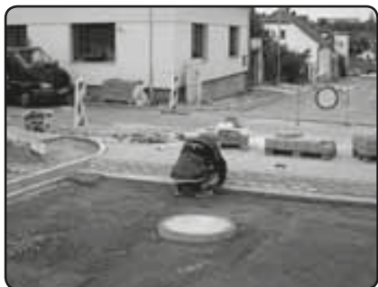
Dláždění zpomalovacích prahů na křižovatce s Dukelskou ulicí (září 2009)