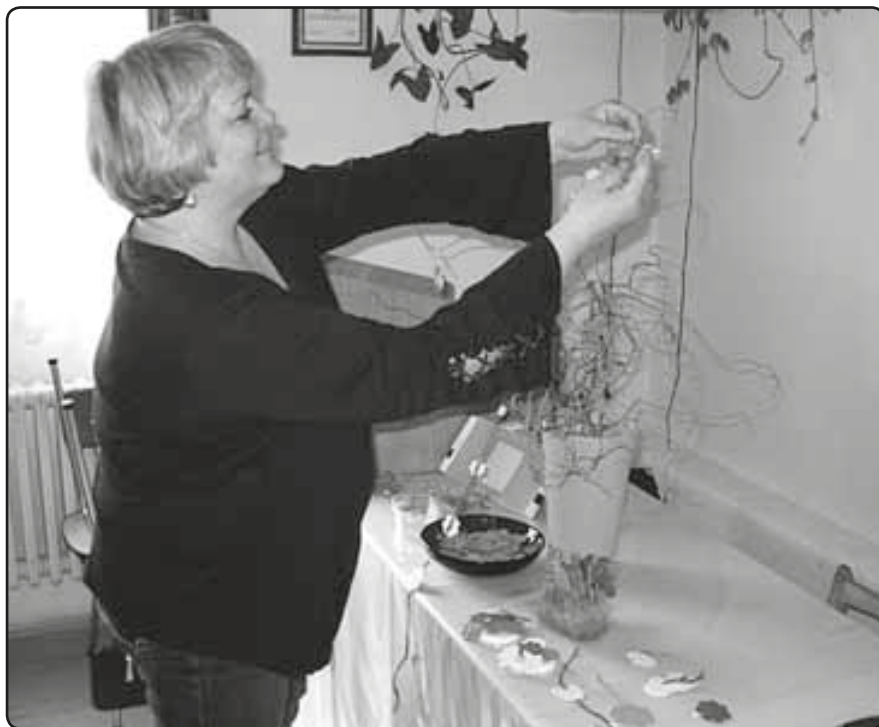
Příprava výstavy v podání sulkovské organizace Českého svazu žen

hřišti apod. Ceny energií jsou však vysoké a péče o majetek (Sokolovna, budova Sparty Sulkov, ubytovna, fotbalové kabiny) je nákladná. Příspěvky od ČSTV jsou velmi nízké a budoucí vývoj v tomto směru je dosti pesimistický. Bez finanční podpory obce by tak byla existence obou sportovních organizací vážně ohrožena. Obecní zastupitelé proto ani při schvalování rozpočtu na letošní rok na tělovýchovu nezapomněli.