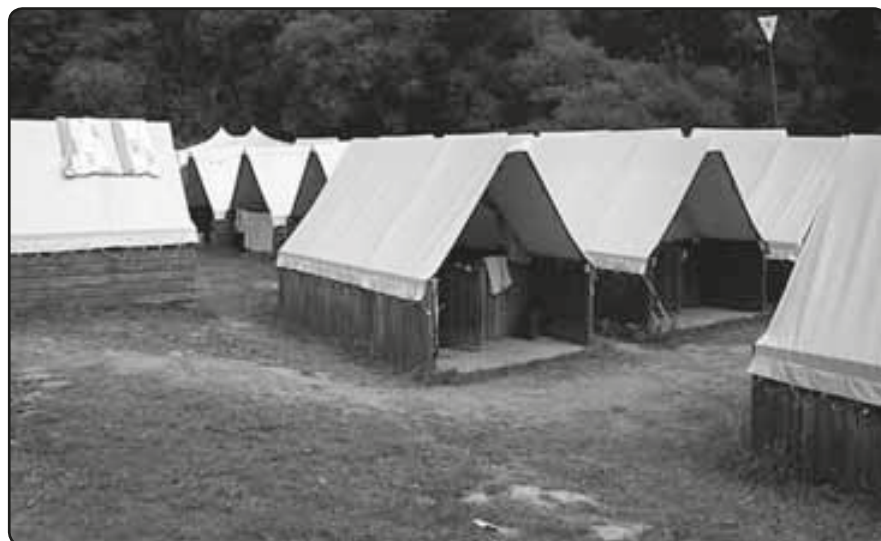
Dětský letní tábor líňské rybářské organizace v Kladrubech u Stříbra

ské soutěže. K tomuto úspěchu se jistě sluší pográtulovat! V TJ Baník Líně působí 12 oddílů, zaměřujících se na fotbal, lední hokej, turistiku, nohejbal, letní biatlon, stolní tenis, tenis, florbal, aerobic, kulturistiku, softbal, karate. Některé z nich se mohou rovněž pochlubit dobrou aktuální výkonností – např. stolní tenisté, hokejisté, letní biatlonisté nebo velmi aktivní turisté. Kromě své hlavní sportovní činnosti se některé oddíly podílejí také na pořádání akcí pro děti (např. maškarní bál pro děti, pořádaný v Sokolovně nebo Dětský den na koupališti). Ekonomická krize bohužel má negativní dopad i na tělovýchovu a situace není zrovna růžová. Odcházejí někteří sponzoři, klesá zájem o ubytování v turistické ubytovně na líňském