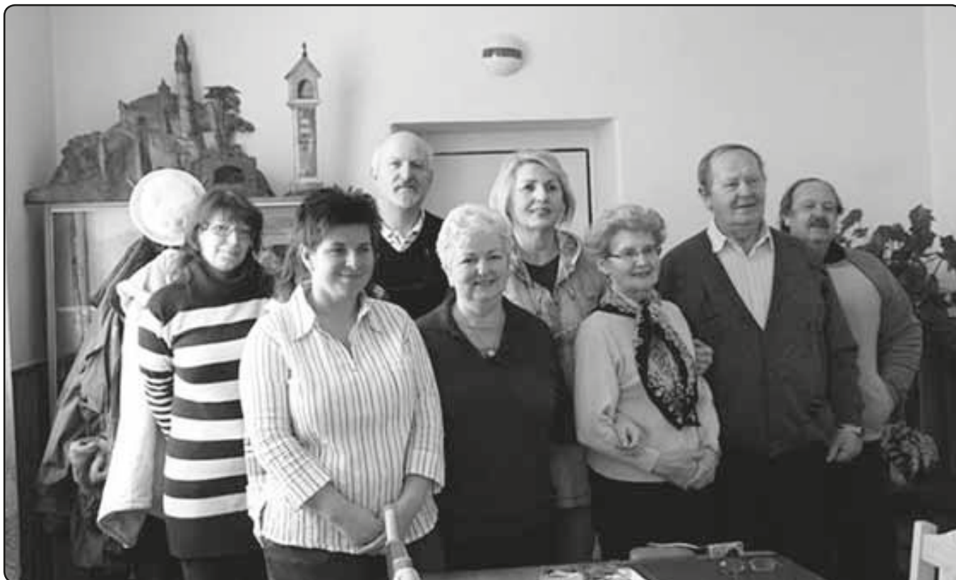
Setkání kronikářů v Chotěšově