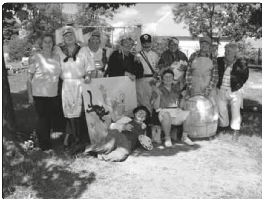
Členky Divadelního souboru DPH po představení v mateřské školce

Významné postavení bezesporu mají místní sportovní organizace – TJ Baník Líně a TJ Sparta Sulkov. Obě mají slušné zázemí pro svoji činnost a nabízejí nejen dospělým, ale též dětem a mládeži příležitost ke sportovnímu vyžití. TJ Sparta Sulkov se zaměřuje výhradně na fotbal. Její dorostenecké mužstvo, v němž hraje také i řada dorostenců z Líní, dosáhlo v loňském roce vynikajícího výsledku – postupu do kraj-