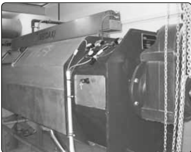
Šnekový lis na kalu