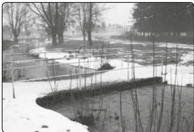
O lávku u návěsního rybníka se již voda zarážela (13. 1. 2011)