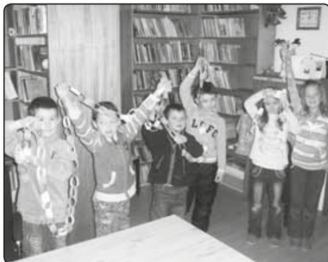
„Nekonečný“ vánoční řetěz

Více fotek najdete na nové webové stránce knihovny na adrese: http://www.line.knihovna.info/ .