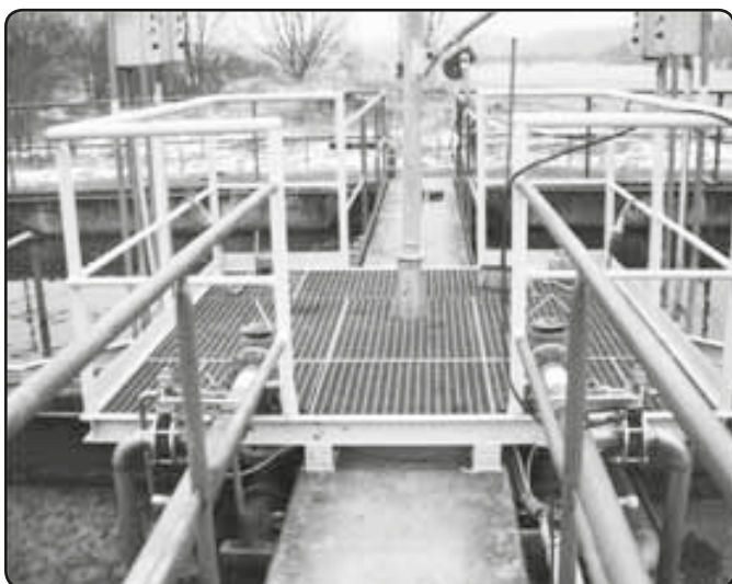
Nová lávka pro obsluhu čistírny