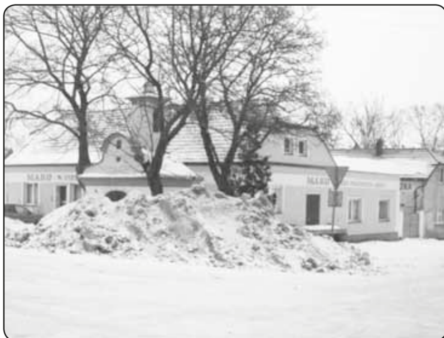
Hromada sněhu u kapličky na líňské návsi

V souvislosti s hrozící povodní ještě jedno poděkování – do třetice. Tentokrát