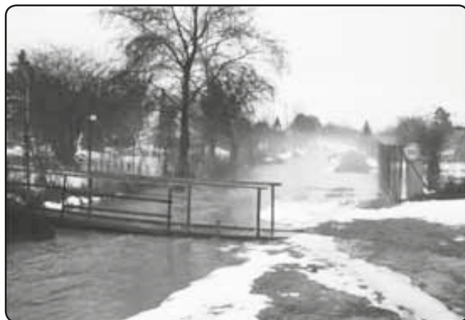
Místní hasiči odstraňují rampouchy ze střechy zdravotního střediska Rozvodněný Zálužský potok v zahrádkářské osadě Ídl (13. 1. 2011)