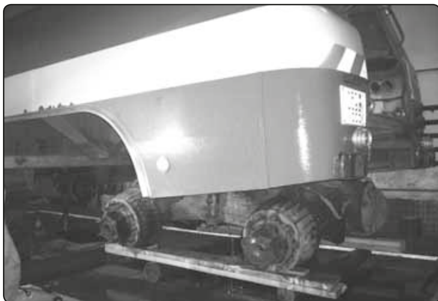
Prověřovací cvičení JPO II a III v objektu letiště Líně

žisek nebyla možná, protože hřídel byla moc poškozená a oprava by trvala moc dlouho a také by se značně prodražila, začali jsme tedy shánět jinou nápravu, měli jsme nakonec štěstí a narazili na koupi celého podvozku z vozidla Tatra 138 CAS za super cenu, prakticky jen za cenu šrotu, když vezmu v potaz, že za tuto cenu nám chtěli prodat jen jednu samotnou nápravu, máme teď náhradní ještě dvě nápravy, převodovku a motor. I takto velkou opravu jsme byli schopni zajistit prakticky sami v našich garážích a odpracovali tak spoustu hodin na tomto vozidle. V současné době je již vozidlo opět plně funkční a zařazeno opět do zásahu. Po této složité opravě vozidla CAS nás čeká další větší akce a to celková rekonstrukce vozidla DA-8 AVIA 31, které je nutno zrekonstruovat prakticky od základu. Je nutno provést vyvaření kabiny, nástavby, celkovou opravu brzd, řízení, vozidlo nastříkat a vybavit novým výstražným zařízením AZD 530. Tato oprava už měla být započata od 1. 12. 2010, jelikož došlo k nepředvídané poruše vozidla Tatra bylo nutno tuto rekonstrukci ještě odložit. Oprava vozidla DA-8 Avia 31 bude započata v nejbližších dnech. Myslím, že jsem vyčerpal vše, o čem jsem Vás chtěl informovat a tak mi zbývá už jen opět poděkovat zástupcům Obecního Úřadu za poskytnuté finanční prostředky, jak na vybavení jednotky, tak i na opravu veškeré techniky a v neposlední řadě za prostředky naložené na přípravbu nové garáže, do které doufáme časem získáme modernější techniku.