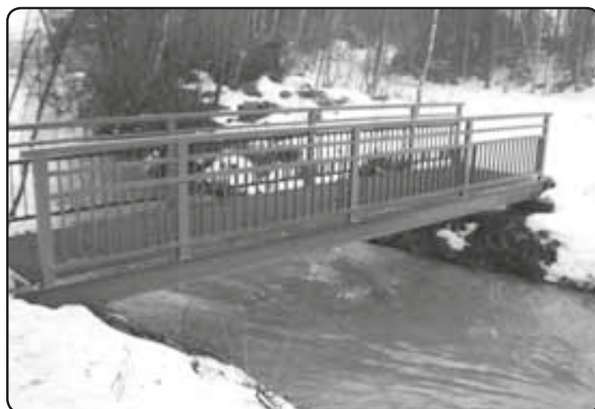
Nová lávka u Sulkova zvládá velkou vodu mnohem lépe než její předchůdkyně (13. 1. 2011)