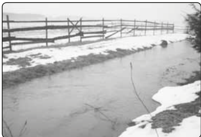
Také Luční potok se naplnil – nejvíce to bylo znát poblíž stadionu Baníku Líně (13. 1. 2011)