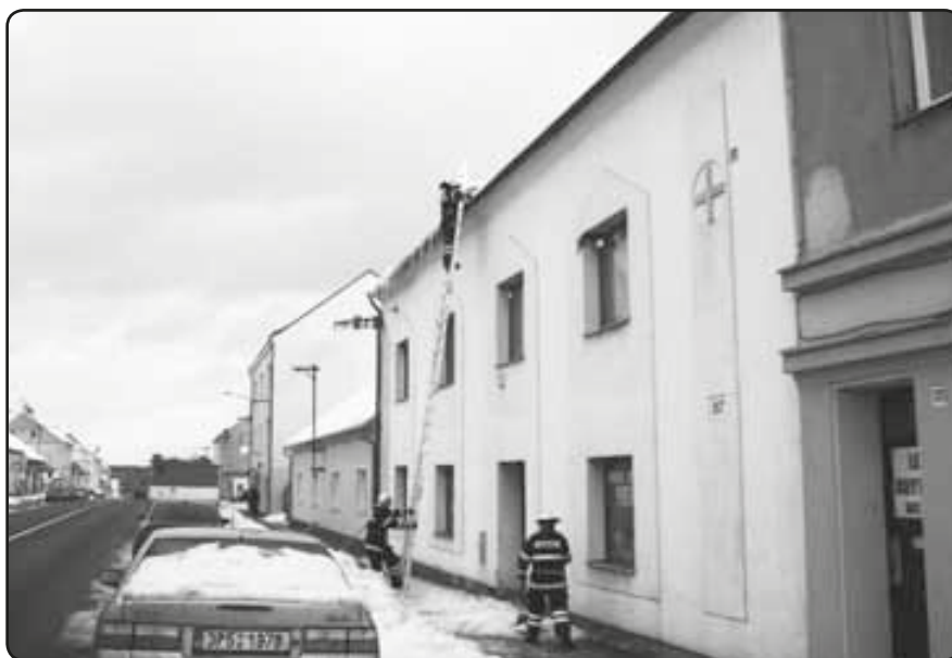
Odstaňování rampouchů z objektu zdravotního střediska

Dne 15. 5. jsme vyrazili na soutěž v požárním útoku do Červeného Újezda na Memoriál Františka Herejky, ještě tentýž den ve večerních hodinách jsme odjeli na soutěž Noční jízda okrsku Hromnice do obce Žichlice, tam jsme vybojovali z 15ti soutěžních družstev nádherné první místo a přivezli si tak krásný pohár věnovaný do soutěže starostou obce Hromni-