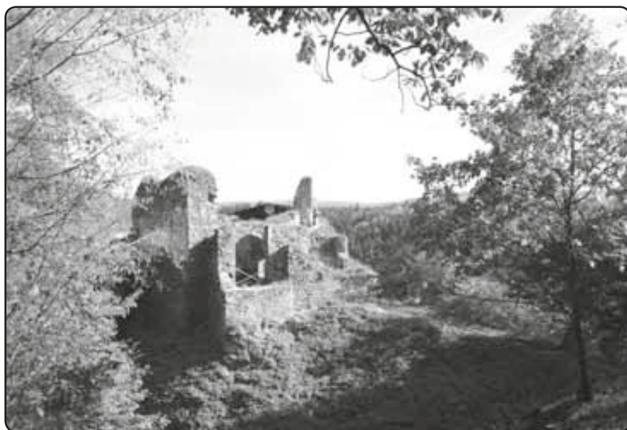
Zřícenina hradu Krašov

Datování této stavební činnosti je za současného stavu vědomostí značně složitě, díky nepočitelným dochovaným detailům lze uvažovat nejspíše o průběhu 14. století. Zcela bez opor jsme při úvahách o časovém zařazení výstavby nové první brány a parkánu, který od ní běžel před čelem a podél jižní strany přední části jádra. Nejspíše se tak stalo ještě před nástupem palných zbraní. Jejich rozvoj si vyžádal v průběhu druhé poloviny 15. století zlepšení obranyschopnosti hra-