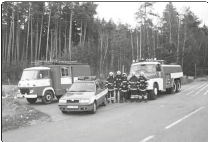
Výcvik jednotky s izolačním dýchacím přístrojem SATURN

Dne 1. 12. jsme odjeli na stanici STK do obce Rybnice, kde vozidlo Tatra 138 CAS 32 podstoupilo pravidelnou prohlídku, kterou prošlo bez vážnějších závad, přestože již při cestě na STK se občas ozývaly divné zvuky a ani přijímací technik z Rybnice nám nedokázal říci, co by to mohlo