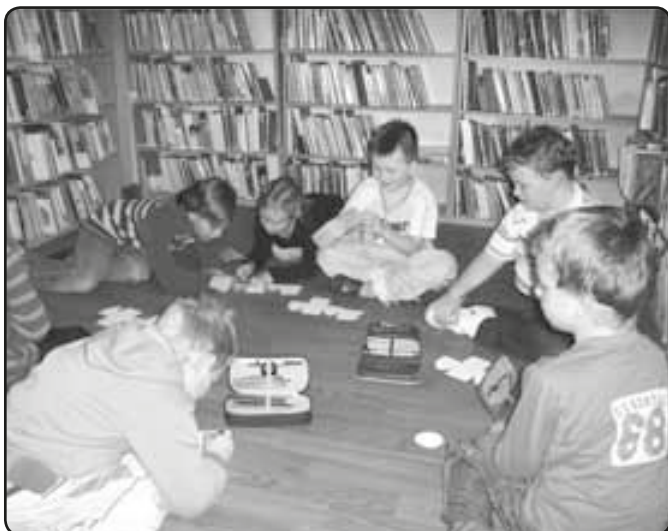
Výroba zasnežených domečků