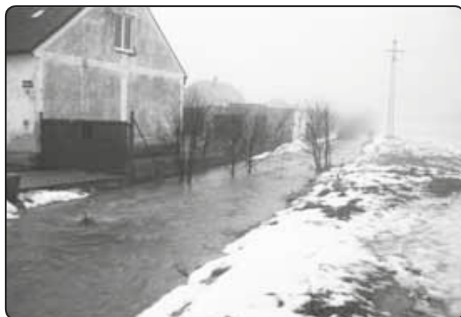
Jen dvacet centimetrů chybělo k zaplavení dvorů a zahrad některých domů (13. 1. 2011)