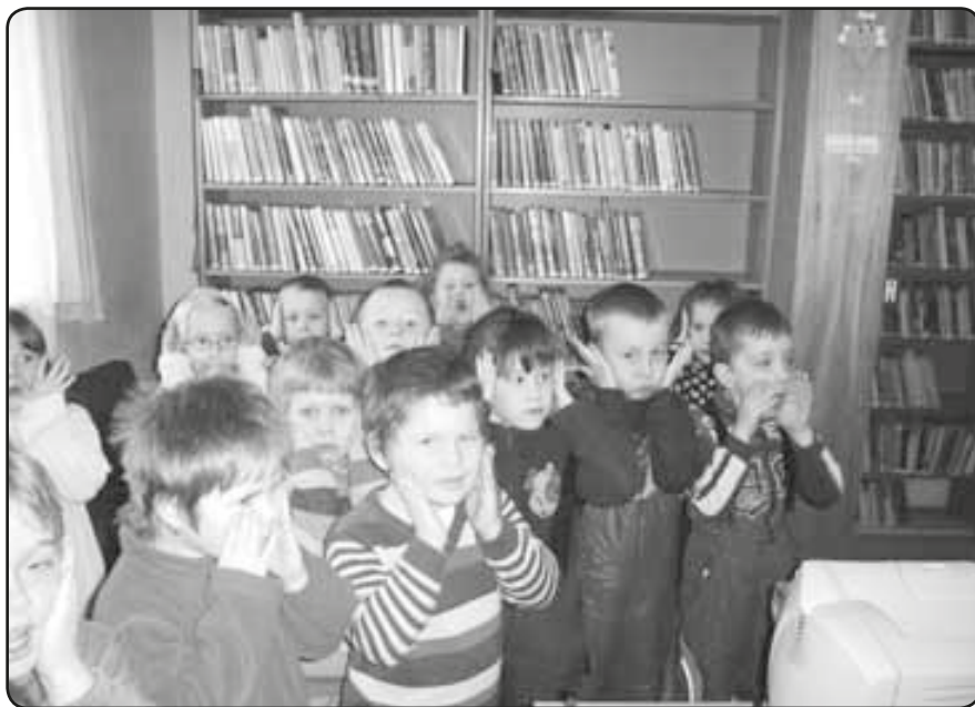
Děti v knihovně předváděly chování zvířat