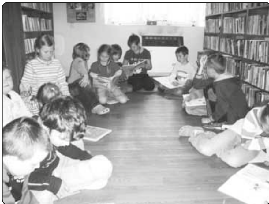
žáci druhé třídy čtou v encyklopediích

krajinu, jejich výstup na sopku Mauna Loa, přechod napříč ostrovem Molokai a další zajímavé obrázky.