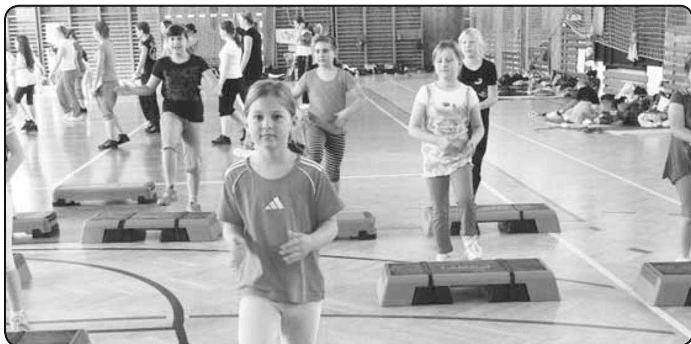
Soustředění v Tlučné