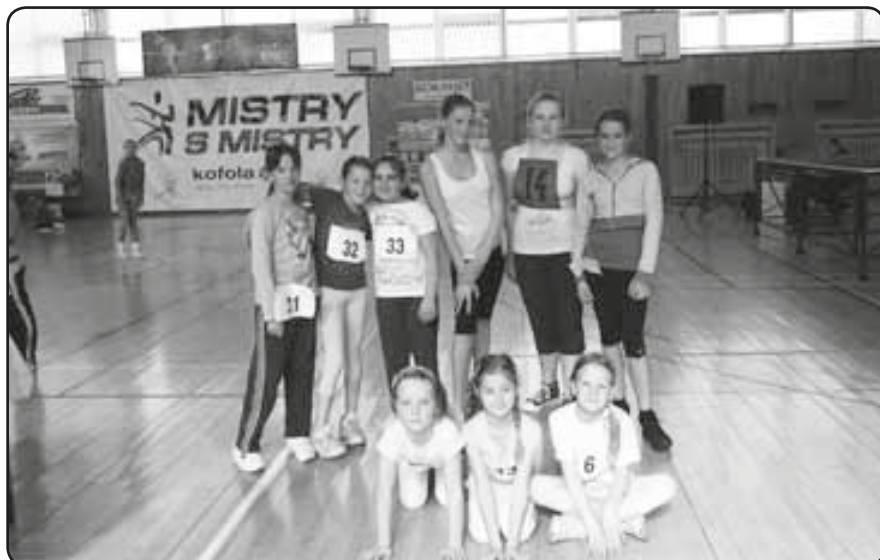
Mistři s Mistry

Mezi líňskými a tlučenskými děvčaty není jen sportovní soupeření. Již potřetí totiž dívky prožily společný víkend na soustředění v Tlučné. Tentokrát od pátku 6. do neděle 8. května si užily hodně pohybu, her a legrace. Při takových akcích vznikají i nová kamarádství. To, že holky spolu „drží basu“, předvedly i v neděli 8. května na plzeňském „Spring cupu“. Na tuto soutěž pohybových sestav odjízděly společně přímo ze soustředění. Navzájem se při cvičení velmi hlasitě povzbuzovaly. Při takovém fandění z nich trochu spadla tréma a sestavy zacvičily s úsměvem na tváři. Jejich výkony se líbily i porotcům, a tak dív-