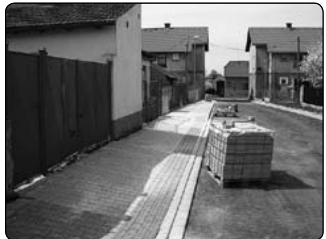
Nově vydlážděný chodník (konec dubna 2012)