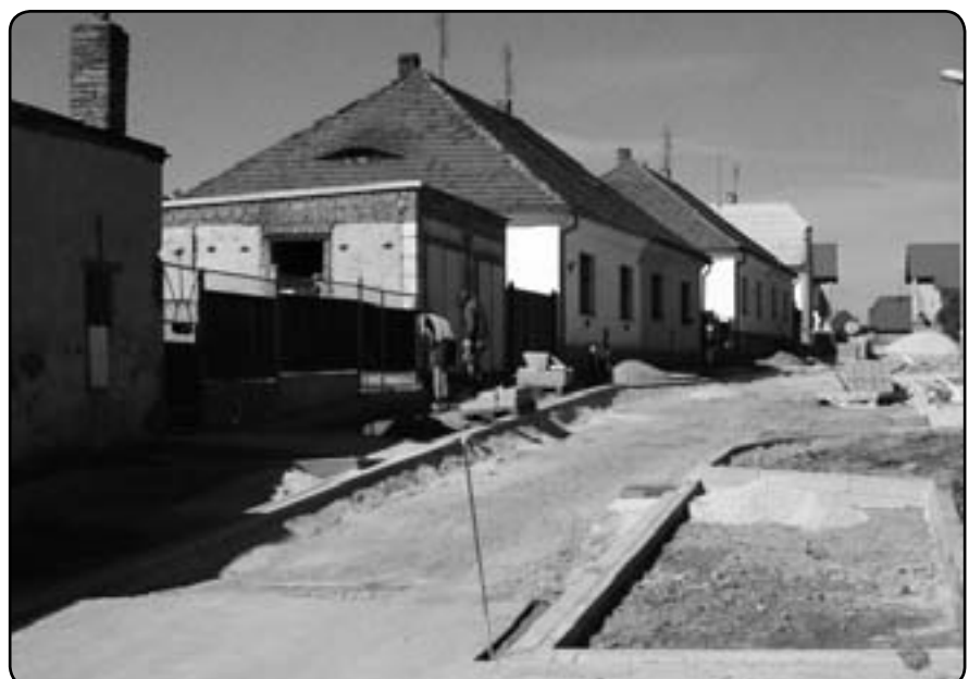
Stavební práce v budoucí obytné zóně (květen 2012)