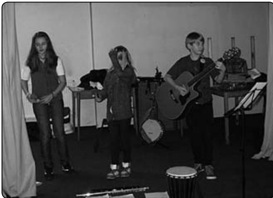
Skupina Jen tak z Plzně

Kultura nás vždy láká, a proto jsme neodolaly pozvání do Prahy na muzikál Vražda za oponou v Hudebním divadle Karlín. Netušily jsme, že termín naší návštěvy se shoduje s dobou konání pražského maratonu. Praha uzavřená a zdálo se, že pro samé uzavírky a objíždky představení nestihneme včas. Ale štěstěna stála při nás a vše dopadlo dobře. Ondřej Brzobohatý v roli detektiva dával celému představení úžasnou dynamiku a živost. Také výkon paní Hany Křížkové nás zaujal.