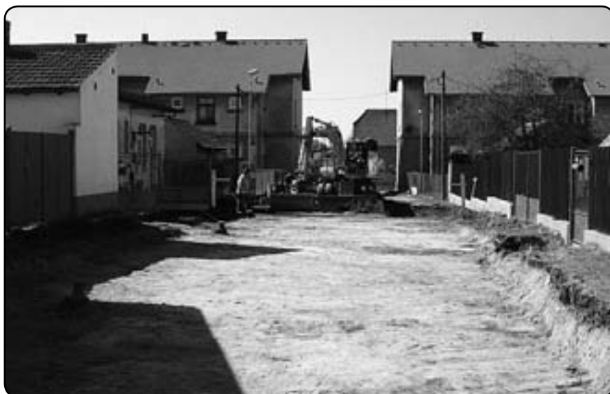
Zemní práce v západním úseku ulice (konec března 2012)