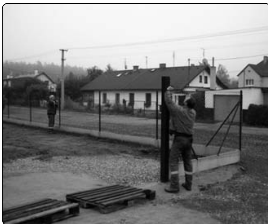
Výstavba nového oplocení (srpen 2011)