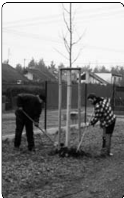
Výsadba nových stromků (listopad 2011)