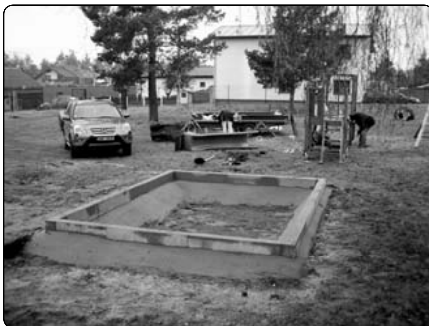
Betonování pískoviště a montáž soupravy herních prvků se skluzavkou (duben 2012)