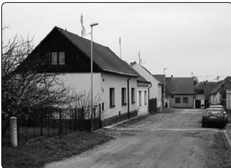
Chodská ulice před rekonstrukcí (2009)

Rekonstrukce místní komunikace v celkové délce 180 m má přispět nejen ke zlepšení dopravní dostupnosti, ale také ke zvýšení úrovně bydlení v severní části obce. Komunikace je z dopravního hlediska řešena v úseku od Hornické do Tlučenské ulice jako obslužná s chodníkem a v úseku od Tlučenské ulice do Družstevní jako obytná zóna se zklidněným provozem. Obytná zóna je vybavena 8 parkovacími místy, určenými pro obyvatele ulice, jejich návštěvy, vozidla