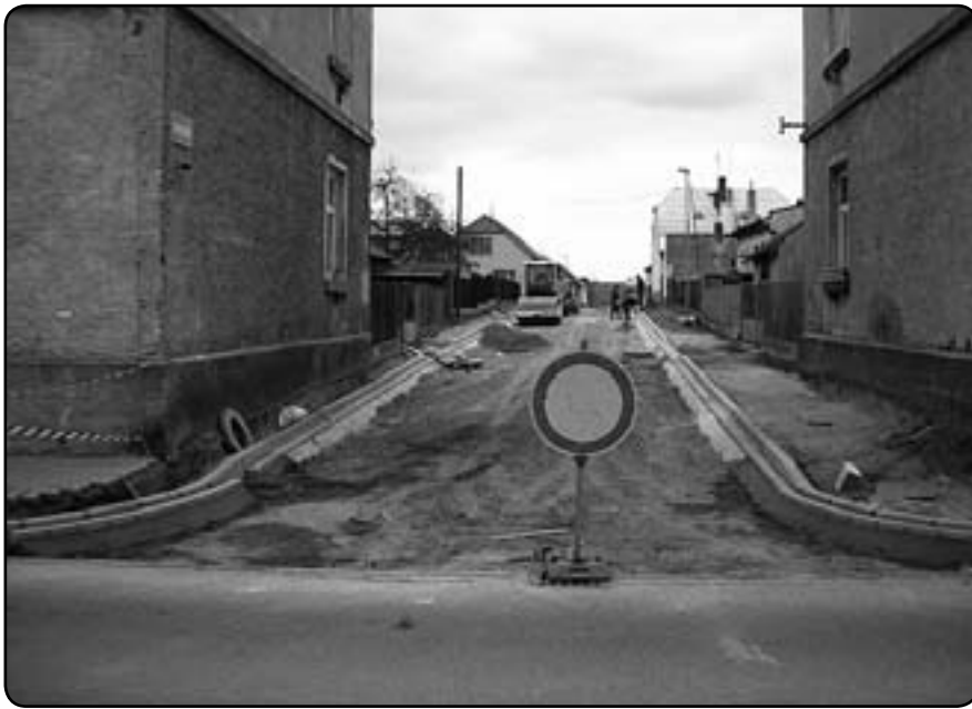
Výjezd do Hornické ulice po osazení obrub (duben 2012)