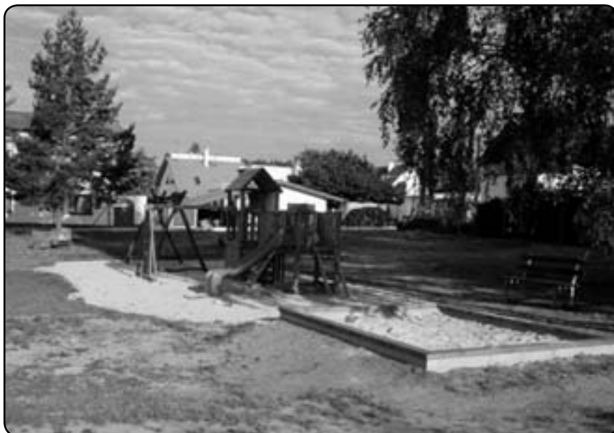
Dokončené dětské hřiště (květen 2012)