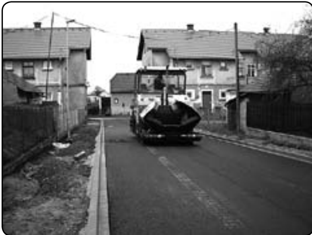
Pokládka spodní asfaltové vrstvy v západním úseku ulice (duben 2012)