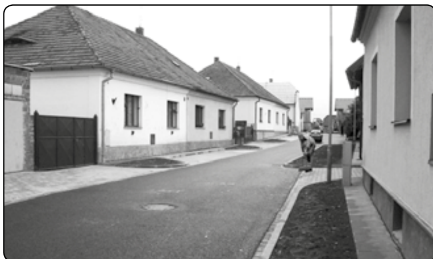
Dokončovací práce v Chodské ulici v červnu 2012

Původní harmonogram, připravený pro realizaci v roce 2010, nebylo možno použít – počítal se zahájením stavebních prací v březnu a s jejich ukončením v září. Zastupitelstvo obce na základě informací o dlouhodobém problému s počtem nepřijatých dětí předškolního věku rozhodlo realizovat projekt ještě v letošním roce. Jelikož k tomuto rozhodnutí došlo