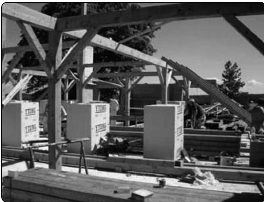
Stavební práce na nástavbě mateřské školy v červenci 2012

na konci března a navíc bylo ještě nutné v souladu s platným zákonem o veřejných zakázkách provést výběr dodavatele, zahájení prací v březnu nepřipadalo již v úvahu. S ohledem na dodržení zákonných lhůt byl nakonec jako termín pro zahájení stavebních prací určen 1. červen 2012, ukončení výstavby se předpokládá 31. října 2012. Vedení Základní školy a mateřské školy Líně operativně zajistilo na období červen – listopad provizorní provoz mateřské školy v prostorách budovy ZŠ 1. stupně. Za největší výhodu je možno považovat využití obou měsíců letních prázdnin, kdy bývá MŠ zpravidla uzavřena. Celkové náklady projektu jsou vyčísleny na 10,792 mil. Kč včetně DPH, výše dotace bude přesně stanovena ve smlouvě o poskytnutí dotace, jejíž podpis lze očekávat v září 2012 (maximální výše může činit až 92,5 % z celkových způsobitelných výdajů projektu).