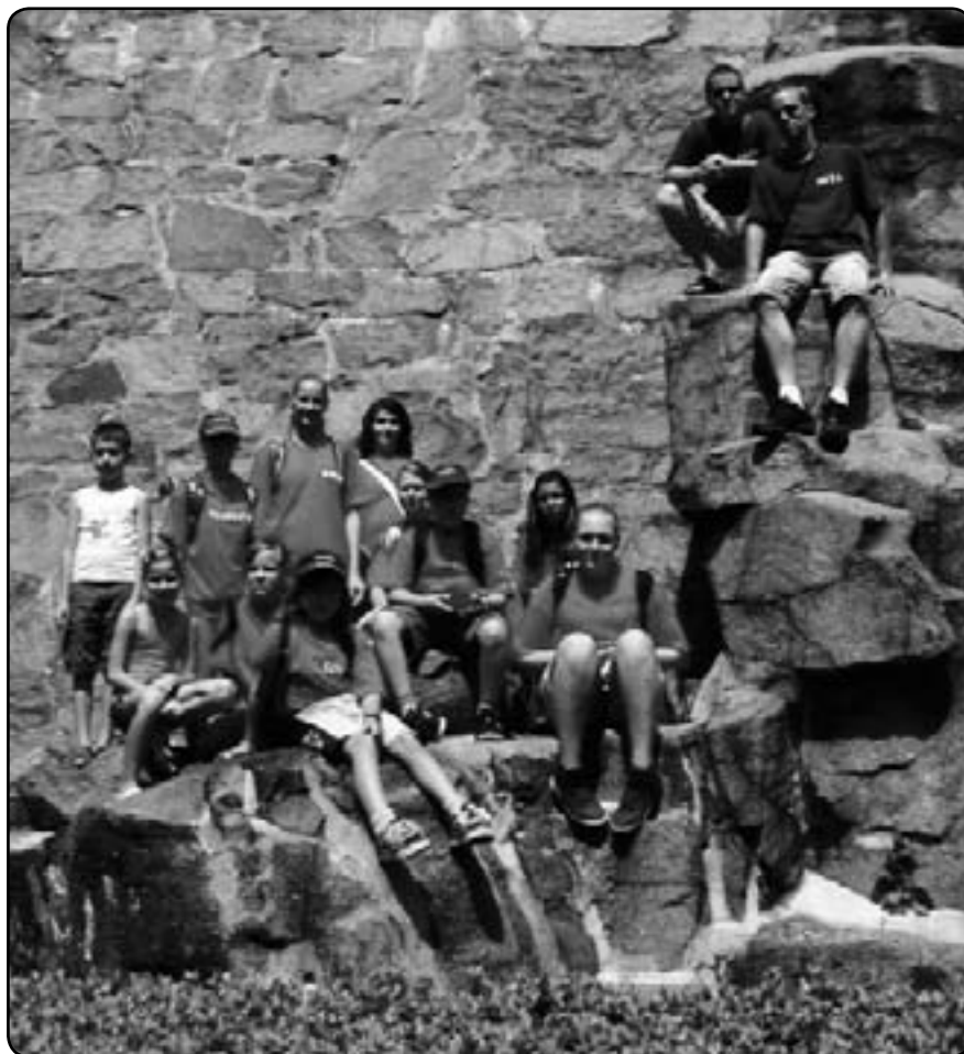
Na Albertových skalách