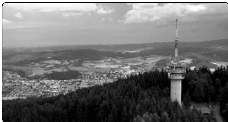
Pohled ze Svatoboru

Radnice (sídlo Městského úřadu) byla přestavěna po požáru roku 1707, další přestavby proběhly v letech 1850 a 1898.