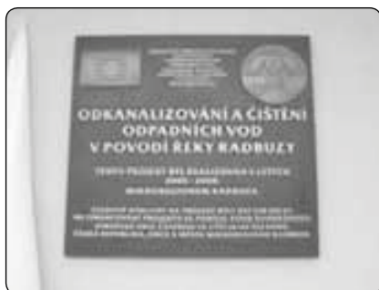
Pamětní deska projektu Čistá Radbuza na budově obecního úřadu v Bělé nad Radbuzou