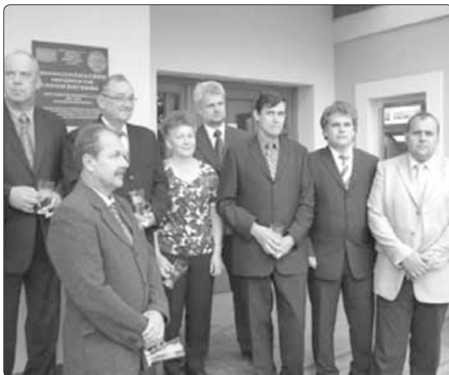
Starostové obcí a měst zúčastněných na projektu při slavnostním ceremoniálu