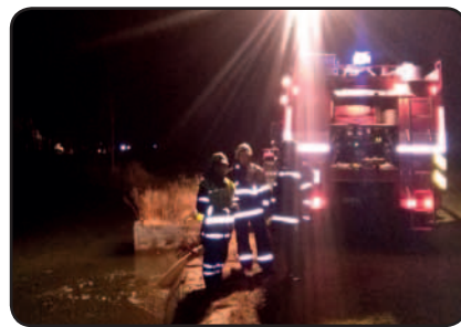
Požár RD Zbůch

Vypracoval Roman Vágner velitel JPO III Líně