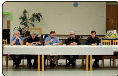
Stůl pracovního předsednictva členské schůze

V osm hodin večer jsme se rozešli domů s nádherným pocitem, že naše celoroční práce a pilné snažení měly svůj smysl.