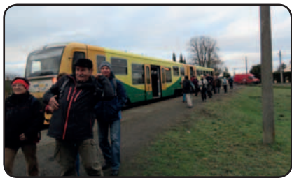
Vlak přivezl turisty na start trasy 12km do Blatnic u Nýřan