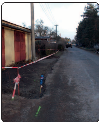
Zahájení prací v ulici Na Perkách na začátku února

V tomto článku bych se rád podrobněji věnoval úpravám komunikací, které probíhají na Sulkově. Jedná se zejména o úpravy ulic Na Pomezí a Na Perkách, včetně propojky těchto dvou ulic. Již koncem letošního teplého ledna zahájila stavební firma, vybraná v rámci výběrového řízení, stavební práce v ulici Na Perkách.