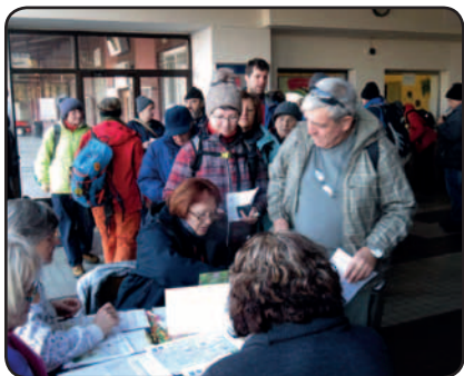
Start tras v Nýřanech na vlakovém nádraží