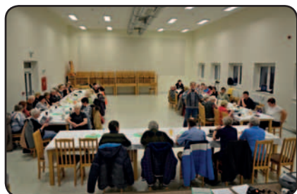
Celkový pohled do sálu