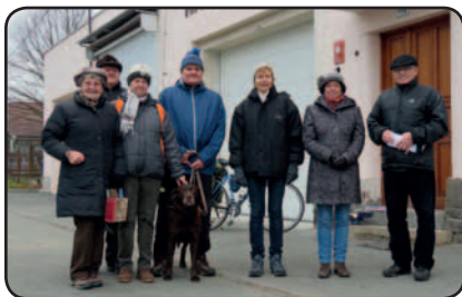
5 členů KČT, odbor Líně a 2 občané Líní na startu Vánočního pochodu