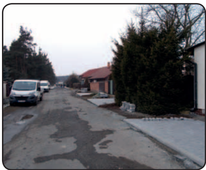
Zahájení prací v ulici Na Perkách na začátku února

ská. I s těmito úseky se výhledově počítá, pozornost se však již může zaměřit i na kdysi zpevněné komunikace s výrazně poškozeným povrchem, jakými jsou např. ulice Polesní, Línská nebo západní část ulice V Zahrádkách. Dobrou zprávou je, že se podařilo do další fáze posunout přípravu projektu na vybudování chodníku v jižní části ulice Na Šachtě, jehož investorem by se v součinnosti s obcí