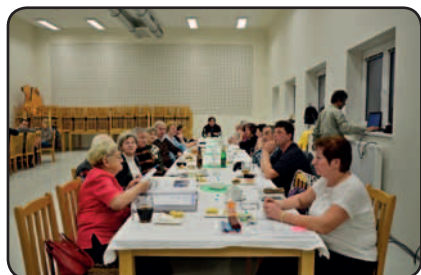
Pohled na účastníky členské schůze

V sobotu 20. ledna 2018, se po třicáté sešli členky a členové Klubu českých turistů, odbor Líně (dále jen KČT, odbor Líně) od 16.30 hodin na volební výroční členské schůzi potřetí v Obecní domě v Líních, aby zhodnotili činnost odboru a zvolili nový výbor a kontrolora KČT, odbor Líně.