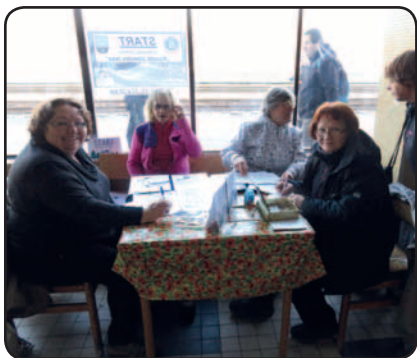
Tým, který startoval trasy 10, 16, 22 a 28km v Nýřanech