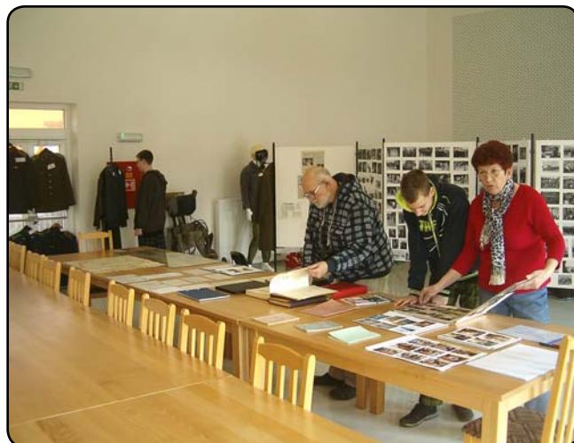
Výstava k 70. výročí 5. stíhacího leteckého pluku