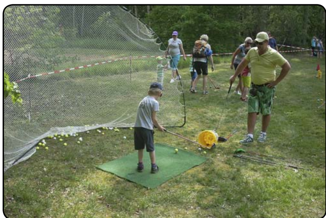
... naučit se základy golfu, ...