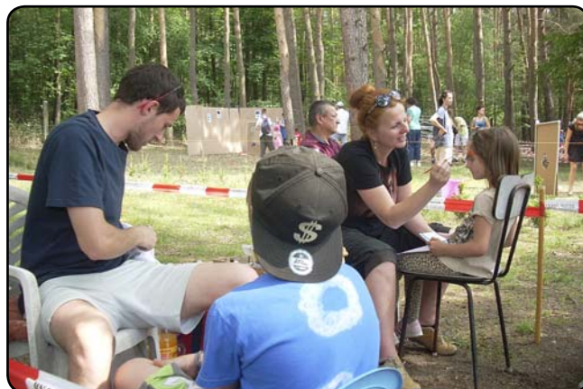
... nechat si vkusně pomalovat obličej, ...