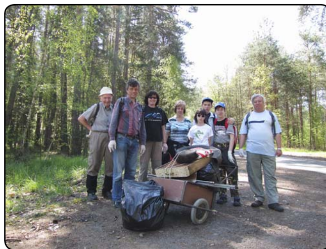
Před mostem přes Luční potok