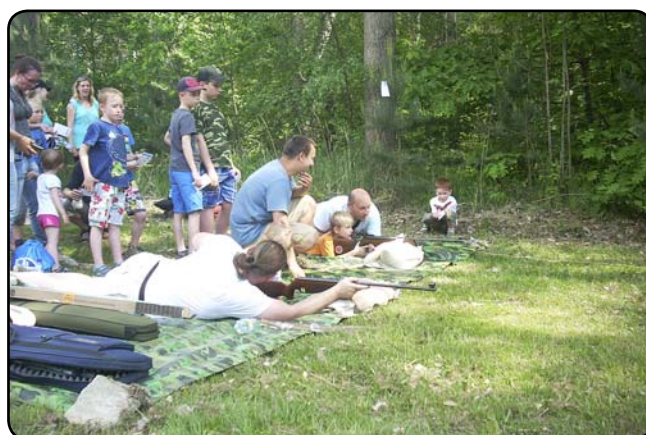
... zastřílet si, ...