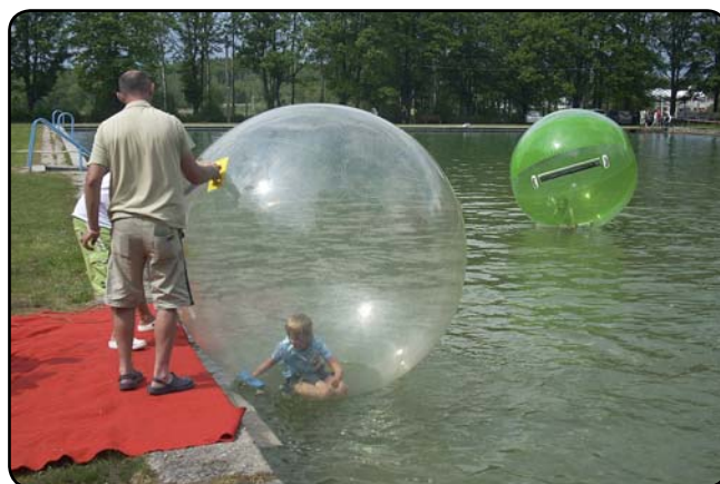
... nebo se nechat zavřít do vodní koule ...