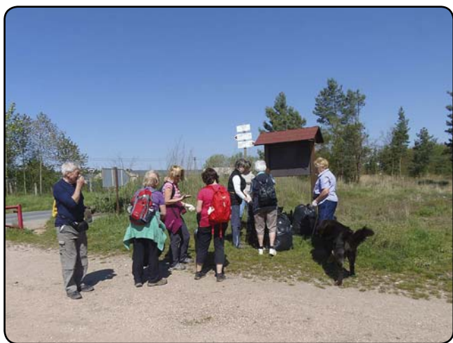
Další hromádka Na Vypichu

Mysleli jsme si, že odpadků bude letos méně, ale mýlili jsme se. Nepořádní lidé nám opět připravili pořádný kus práce. První skupina, která sbírala