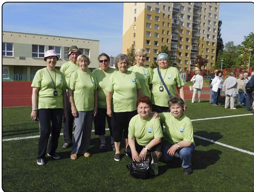
Naše sportovní družstva

vali. Někdo se chtěl jen rozhýbat, jiný se bavil, ale byli tu i ctižádostivci, kteří bojovali o život, ze všech sil a v existujícím horkém počasí tak někteří po ukončení disciplíny zkolabovali. Soutěžilo se v 5 disciplínách: hod míčkem na cíl, pentang, 400m chůze s trekovými holemi, běh s míčkem na tenisové raketě, běh s kolečkem – vše na čas. Nepřipravovali jsme se jako vrcholoví sportovci, chtěli jsme se přesvědčit, na co stačíme a co dokážeme. A trochu jsme se i pobavili. Po ukončeném zápolení jsme skončili v Totemu, kde nás čekalo občerstvení a vyhlášení výsledků. V následném pro-