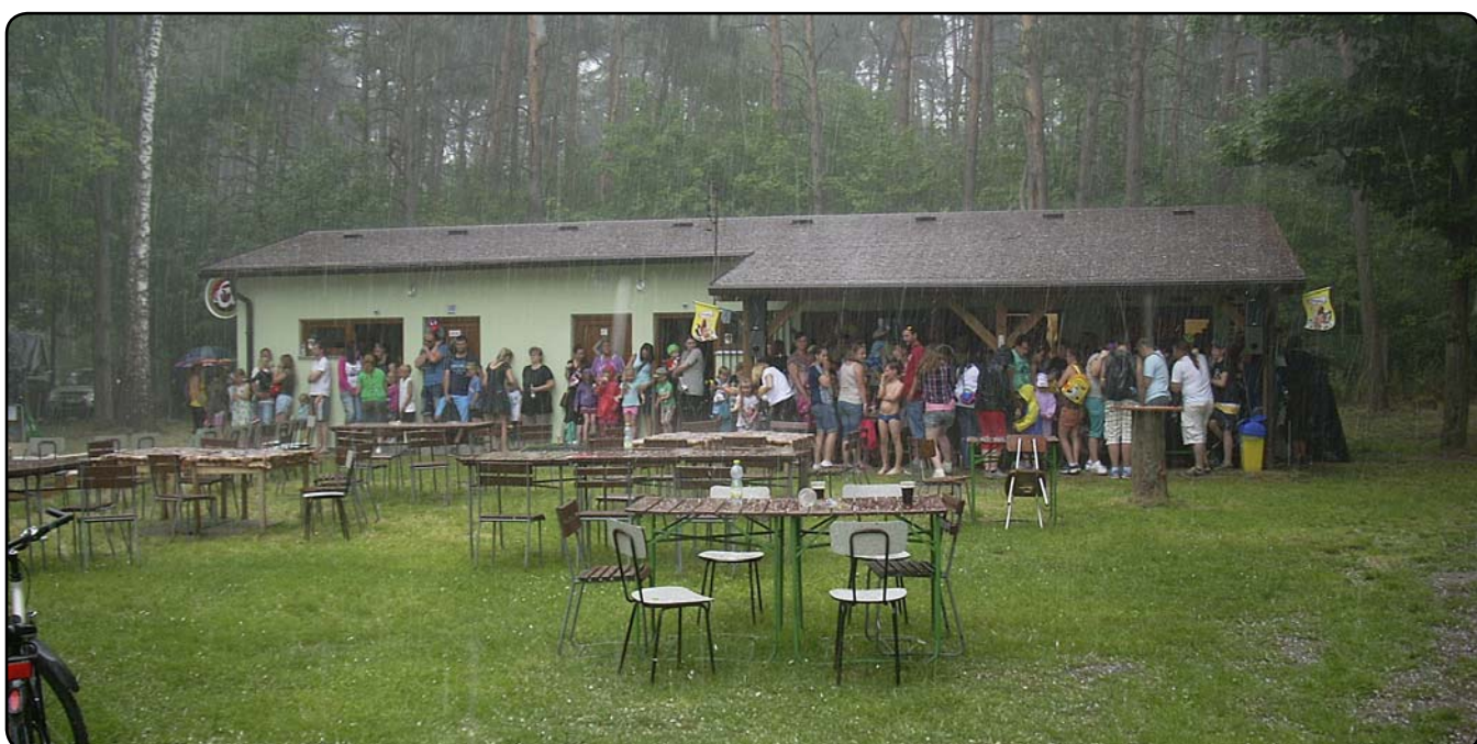
... dokud vše neukončila průtrž mračen s kroupami.