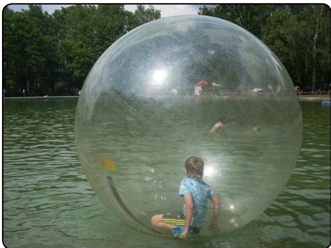
... a nechat se v ní unášet po vodní hladině, ...