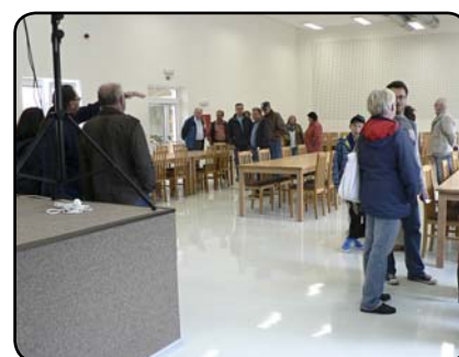
Veřejnost v sále Obecního domu při slavnostním otevření