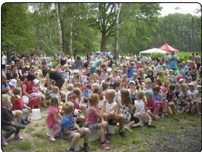
Pak už se s napětím čekalo na divadlo, ...