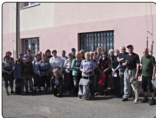
Účastníci úklidu v detailu