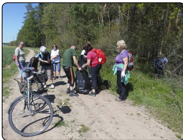
Zde byla největší černá skládka