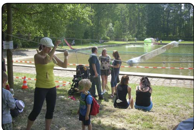
... zasoutěžit si v zajímavých disciplínách, ...