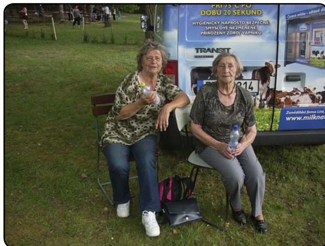
... a za odměnu obdržet jeden zdravý nápoj od příjemné obsluhy.