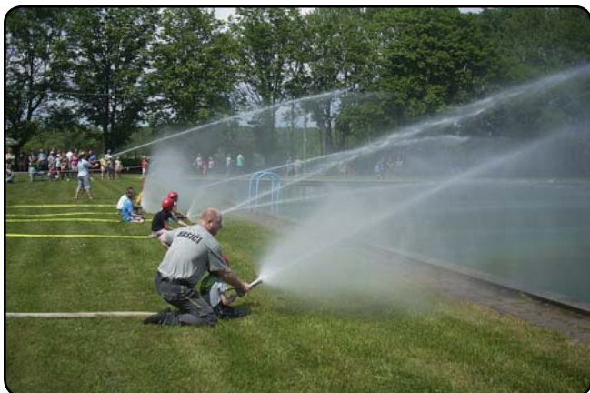
Děti si mohly spolu s hasiči zastříkat, ...