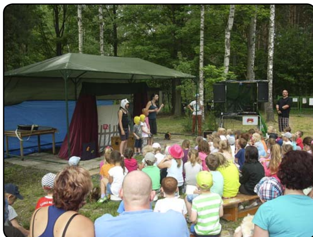
... které se všem velmi líbilo, ...