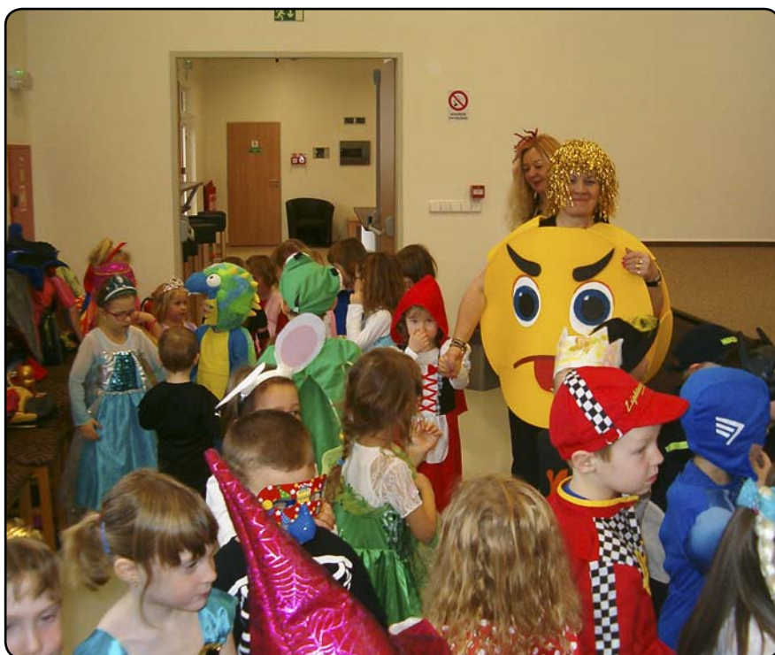
Karneval mateřské školky

spolků, 2 cestopisné přednášky, 1 zdravotní přednáška, 2 kreativní dílničky pro děti, 2 divadelní představení pro I. stupeň základní školy, 1 akce školní družiny, karneval a besídka mateřské školy, 1 akce pro ženy, zajímavá výstava k 70. výročí 5. stíhacího leteckého pluku, 3 šachové turnaje, před několika týdny byl v objektu start i cíl tradičního turistického pochodu „Líňský maraton“. Každý čtvrtek se sál zaplní mladými šachisty, kteří docházejí na svůj oblíbený šachový kroužek, pořádaný Šachovým klubem Líně. Pravidelně se v prostorách Obecního domu konají také zkoušky divadelního souboru „DPH“