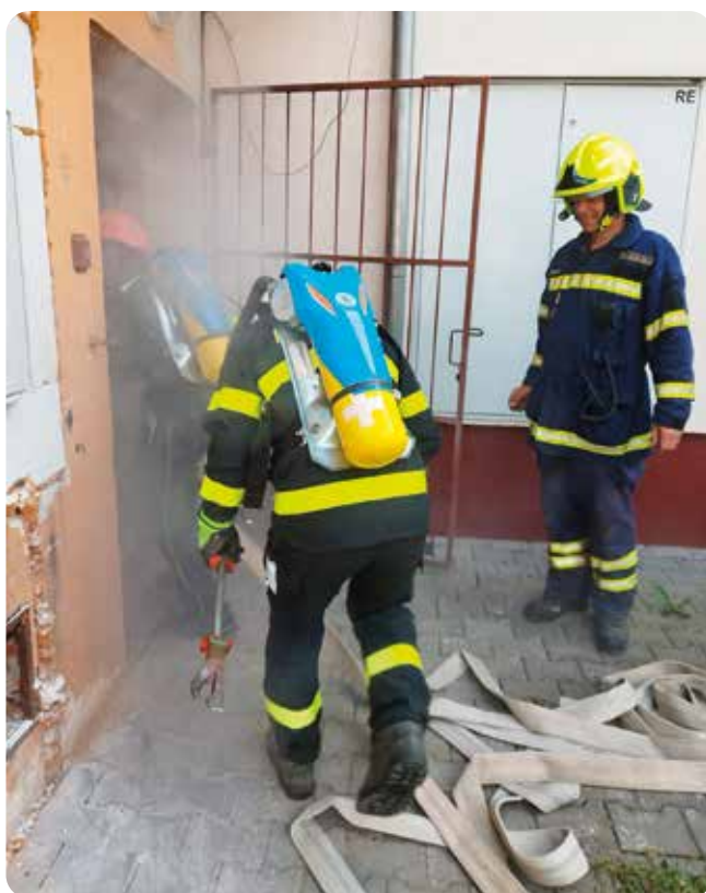
Výcvik s IDP