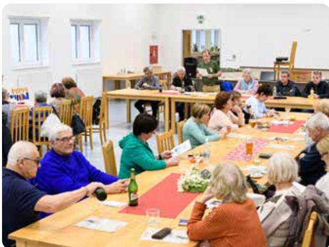
Jiný pohled na účastníky členské schůze

Co jsme v loňském roce dokázali uskutečnit?