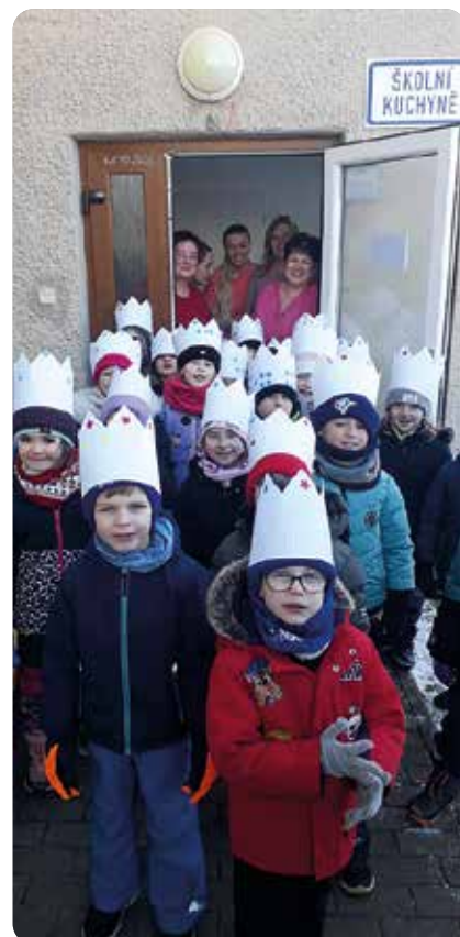
Tři králové - Sovičky u školní jídelny

sporty. Nechybělo opravdové lyžování ani snowboardování, odvážlivci se pustili i do krasobruslení na zamrzlé louži na poli u garáží. Velký úspěch měl hod olympijských kruhů na cíl a samozřejmě lední hokej, při kterém se děti vžily do role plzeňských hokejistů - Indiánů. Na konci týdne proběhlo vyhodnocení olympijských her, slavnostní předání medailí a vystoupení na stupínky vítězů. Všichni jsme si to moc užili!