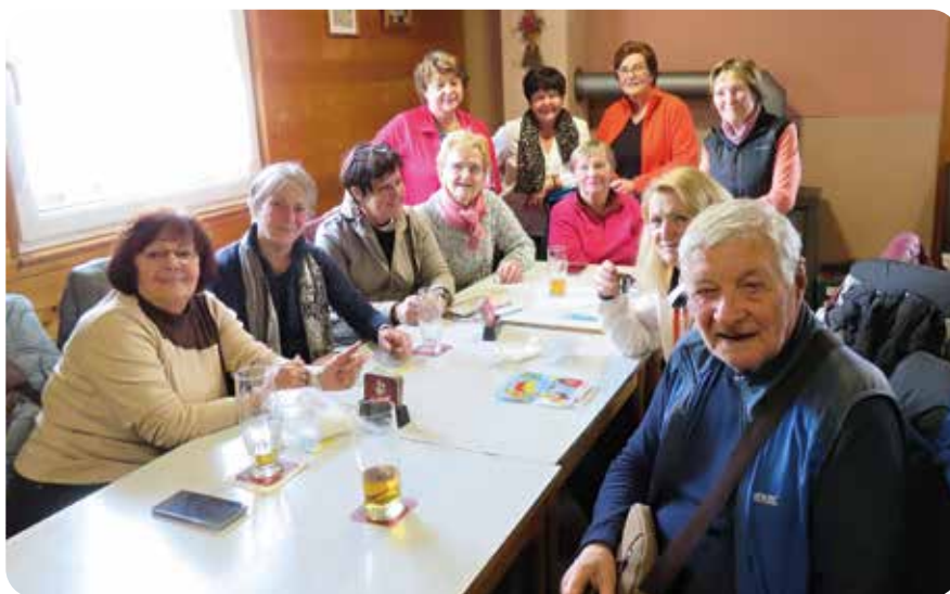
Společné foto členů KČT, odbor Líně

Pro pěší turisty jsme připravili trasy 12 a 21 km startující ze Zbůchu a trasu 7 km, která byla odstartována z Líní. Start tras a cíl pochodu ve Zbůchu v restauraci V Cihelně