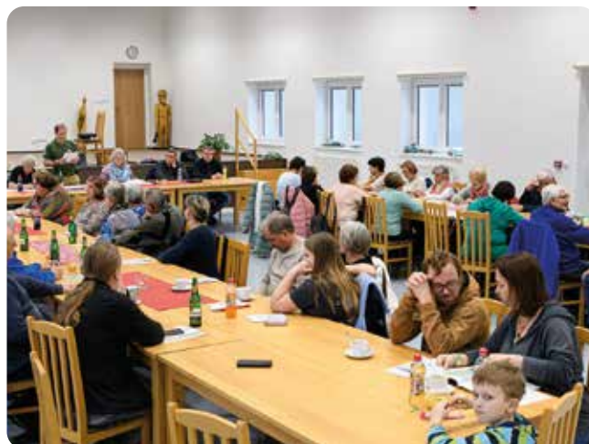
Pohled na účastníky členské schůze