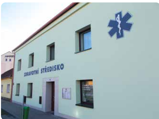
Zdravotní středisko nyní vypadá mnohem lépe