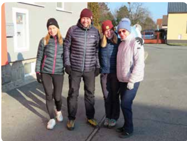
Na startu Vánočního pochodu u hasičárny v Líních