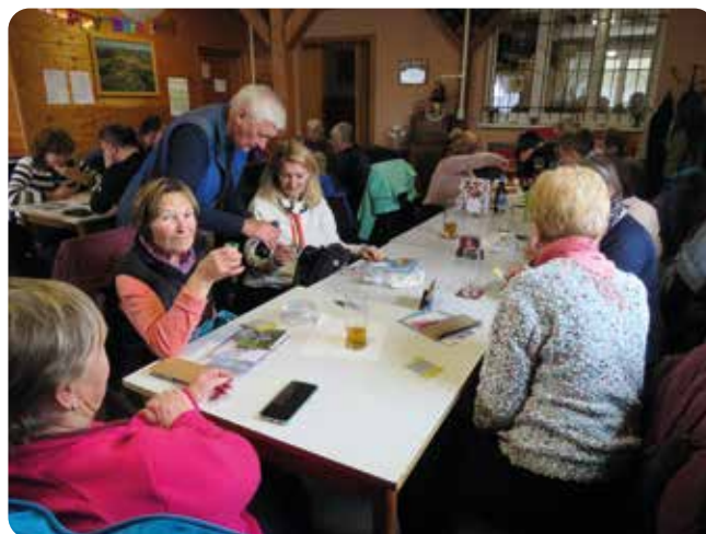
Předvánoční pochod - spokojení členové KČT, odbor Líně