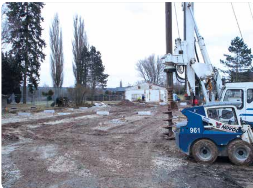
Stavba sportovní haly byla zahájena v prvních dnech nového roku

Část projektů bude brzy dokončena, další budou pokračovat. S koncem zimy samozřejmě stavební ruch neutichne, naopak se spíše rozšíří. Hlavní stavební akcí zůstane