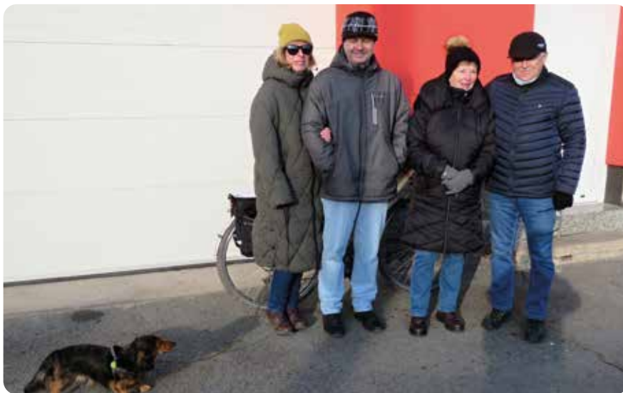
Dostavili se také manželé Šedivých a manželé Pakandlovi