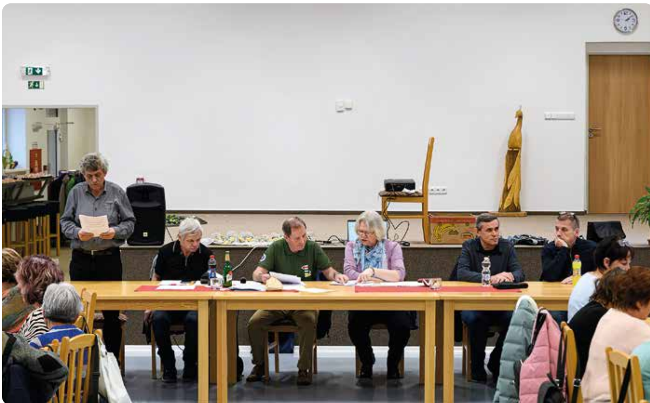
Pohled na stůl předsednictva schůze a hosty členské schůze

V sobotu 17. ledna 2026 se sešli členky a členové Klubu českých turistů, odbor Líně (dále jen KČT, odbor Líně) od 14 hodin na členské schůzi v Obecním domě v Líních, aby zhodnotili bohatou činnost v roce 2025.