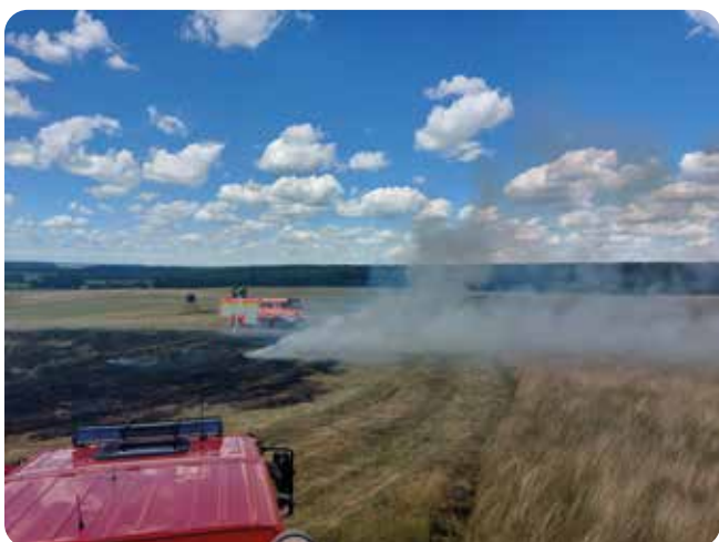
Požár travního porostu