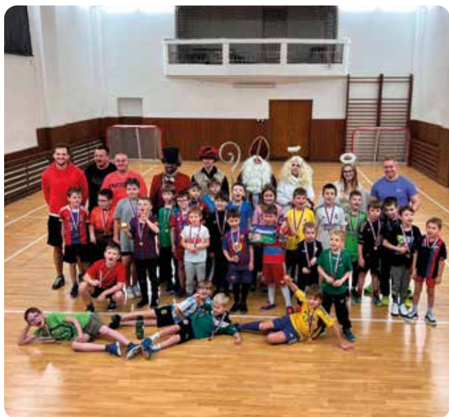
I loni, jako tradičně každý rok, jsme v Sokolovně pořádali pro děti mikulášskou nadílku.