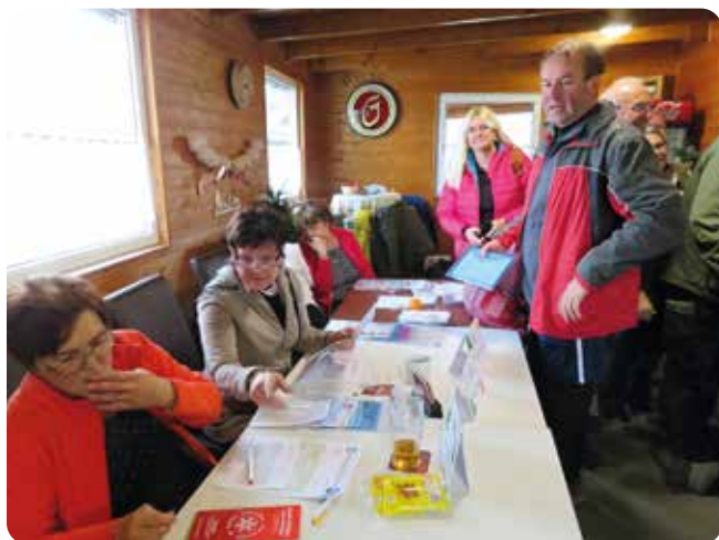
Cíl pochodu byl ve Zbůchu v restauraci V Cihelně