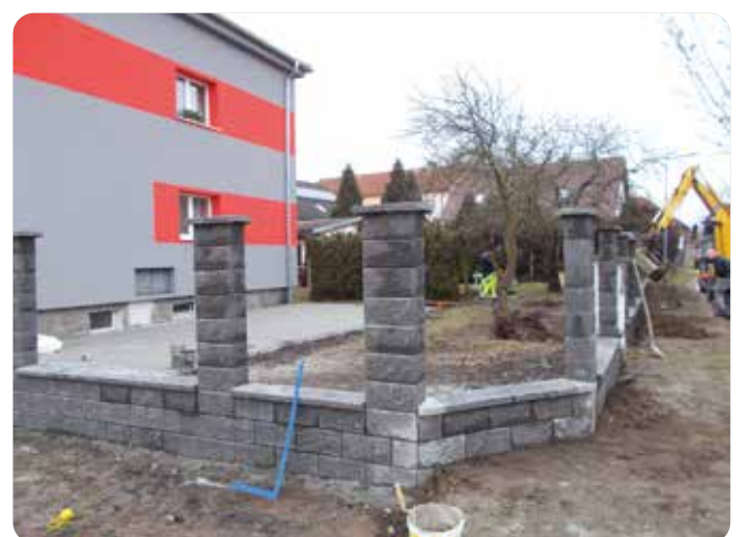
Probíhá výstavba nového plotu hasičské zbrojnice