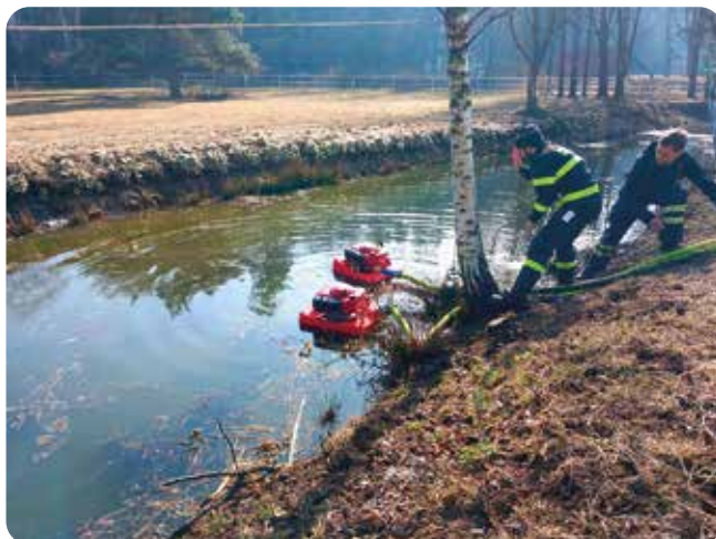
Výcvik s čerpadly