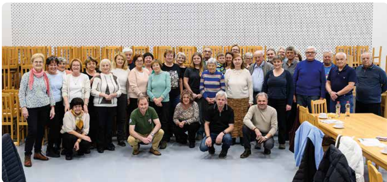
Společná fotka účastníků členské schůze Klubu českých turistů, odbor Líně