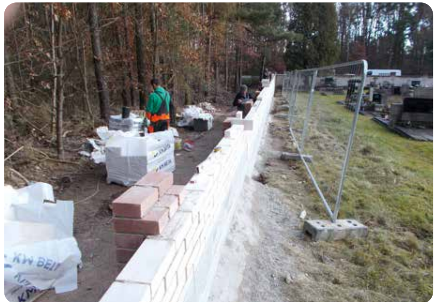
Poškozená východní zeď místního hřbitova je již minulostí