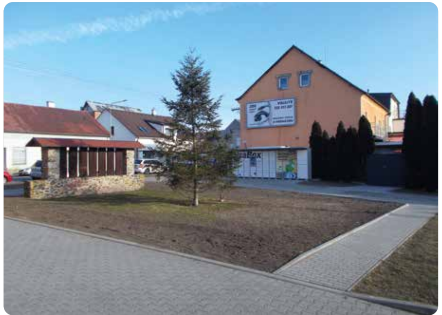
Před Vánocemi byly provedeny úpravy prostoru u budovy obecního úřadu

A nakonec nelze opominout největší stavební akci posledních let, kterou je bezesporu výstavba