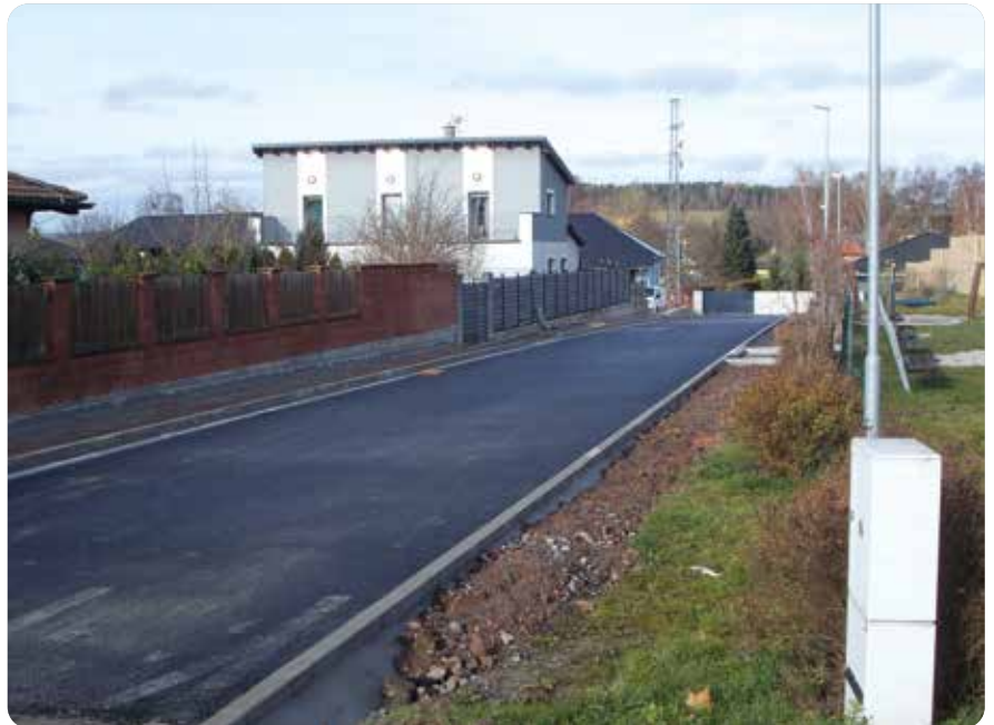
Součástí komunikačního systému v severozápadní části Líní je propojení ulic Polní a Ke Křížku

Během listopadu a prosince probíhala již 3. etapa výstavby komunikačního systému v severozápadní části Líní , spočívající především ve vybudování nové komunikace propojující ulici Ke Křížku s ulicemi Hornická a Polní. Během nejbližších týdnů bude projekt pokračovat zpevněním dosud prашného úseku ulice Rybářská, čímž vznikne kvalitnější spojení ulic Polní a Úherecká. Bude tak dokončena nová komunikační síť, jejíž budování započalo před pouhými dvěma roky, tedy ve druhé polovině roku 2024.