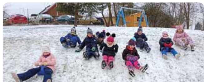
Sovičky sněhové radovánky